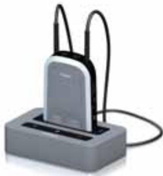
Phonak ComPilot met Phonak TVLink S basisstation

Vraag uw audicien om te demonstreren wat er allemaal mogelijk is met de Phonak draadloze accessoires.