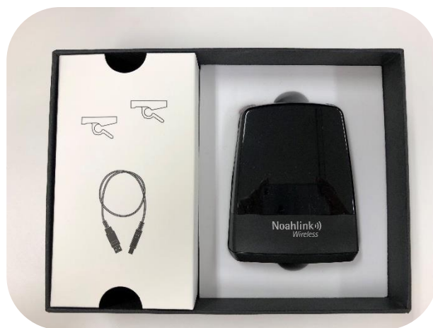
ノアリンク ワイヤレス 全体梱包図