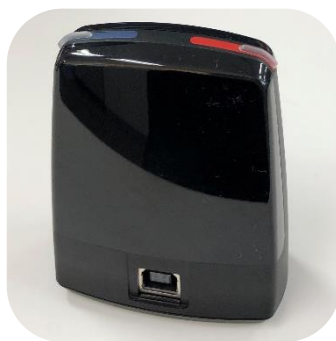
ノアリンクワイヤレス本体