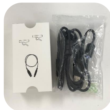
接続ケーブルと固定ホルダー