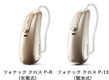
フォナック クロス P-R (充電式) フォナック クロス P-13 (電池式)