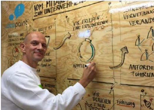
Graphic Recording by Matthias Grädler

Vision Hörakustik – Zukunft gemeinsam gestalten.