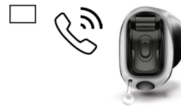
EasyPhone mit Taster

Standard (Option für kleinstmögliche Bauform) Optional