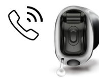
EasyPhone mit Taster

Gehörgangslänge: komplett abgeformter erster UND zweiter Knick notwendig