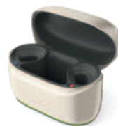
Phonak ChargerGo RIC Sphere I