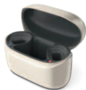
Phonak Charger RIC I