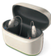
Phonak ChargerGo RIC I