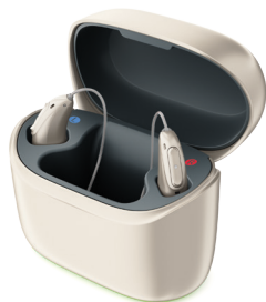
Phonak Charger Ease