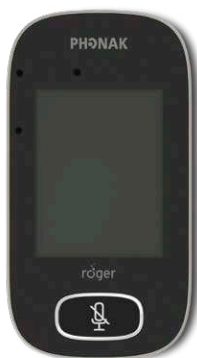
Roger Touchscreen Mic