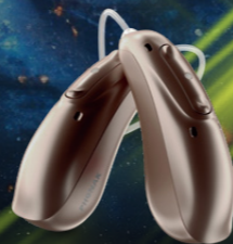
2022 Lumity ルミティ