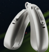
2020 Paradise パラダイス