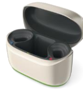
Phonak ChargerGo RIC Sphere I