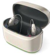
Phonak ChargerGo RIC I