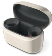
Phonak Charger RIC I