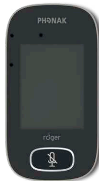
Roger Touchscreen Mic