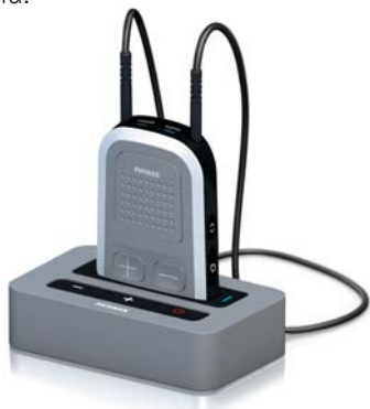
Phonak ComPilot i stacja bazowa Phonak TVLink S

Aby poznać możliwości niesamowitych akcesoriów bezprzewodowych firmy Phonak, skontaktuj się z protetykiem słuchu.