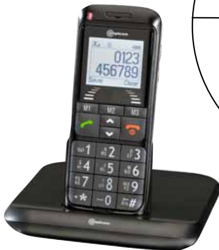
GSM Amplicom M5010 in handige oplader