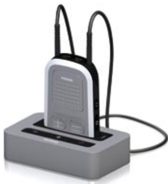
Phonak ComPilot avec la station de base Phonak TVLink S

Demandez à votre audioprothésiste de vous montrer ce que les étonnants accessoires sans fil de Phonak sont capables de faire.