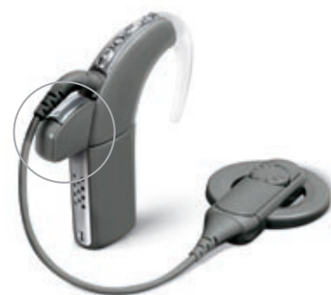
ML14i monté sur Nucleus 5