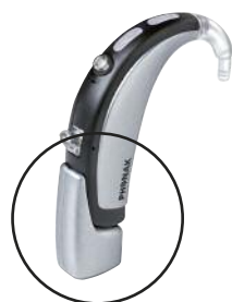
Aide auditive avec récepteur FM miniature