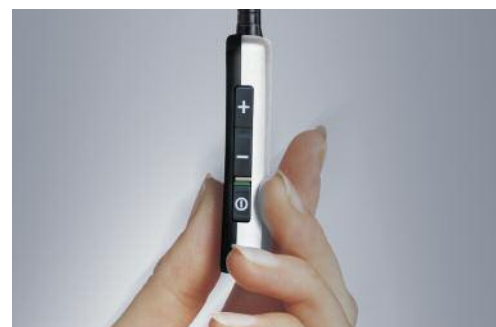
Contrôle de volume (+/-) et commutateur marche/arrêt