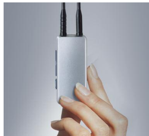
MyLink, un récepteur FM universel